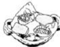
Dulces Chilenos (chilenitos, empolvados, etc)