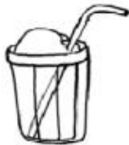
Terremoto de niños