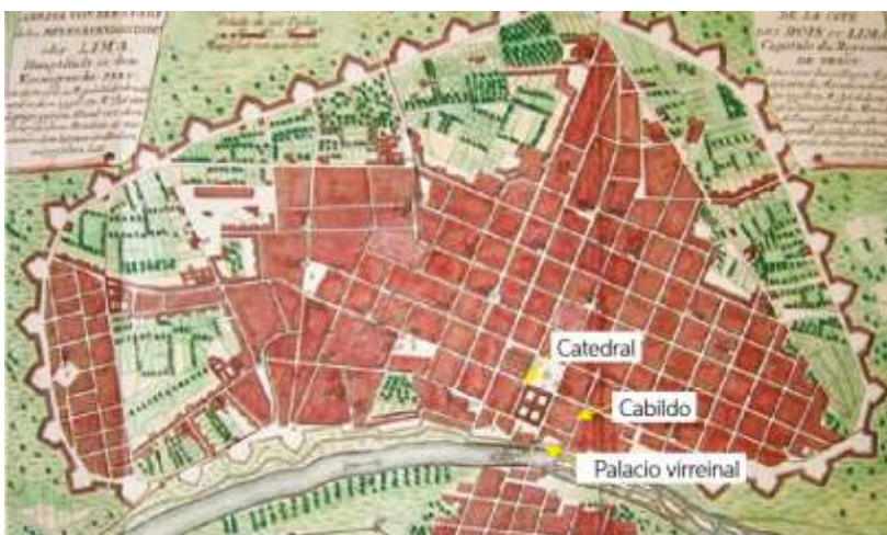
C Plano de Lima (1750), atribuido a Jacques Nicolás Bellin.