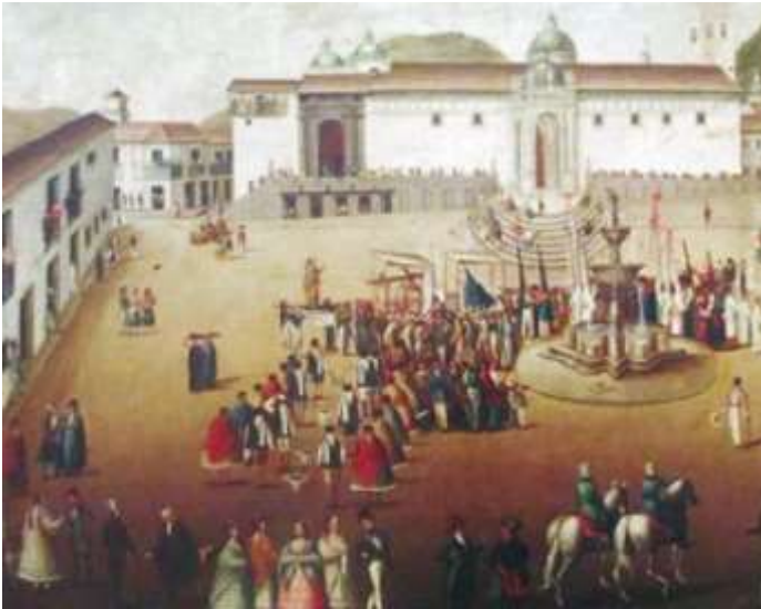
E Anónimo (Siglo XVIII). Plaza principal de Quito.

1.- ¿Qué elementos de la fuente A se reflejan en las fuentes C y E ?