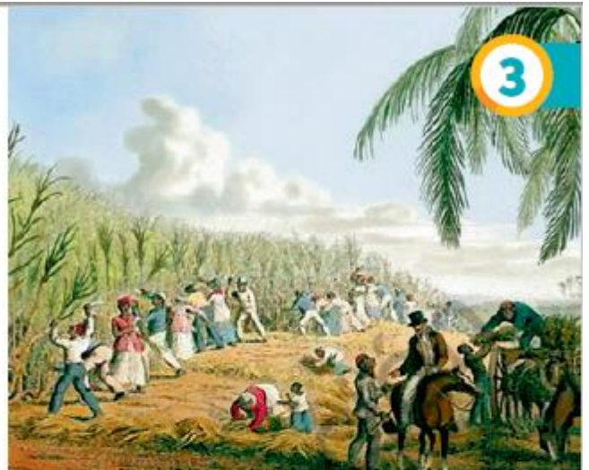
↑ Clark, William (1823). Recolección de caña de azúcar. [Grabado].

La minería fue la actividad económica más lucrativa de América. En una primera etapa los conquistadores se enriquecieron gracias al saqueo de los tesoros americanos, apoderándose del oro y la plata de los incas y los aztecas. Una vez agotadas esas riquezas, explotaron las minas de oro y plata que se descubrieron a lo largo de todo el continente. Para estas faenas se utilizó mano de obra indígena en diferentes sistemas de trabajo, predominando el reclutamiento forzado de ella.