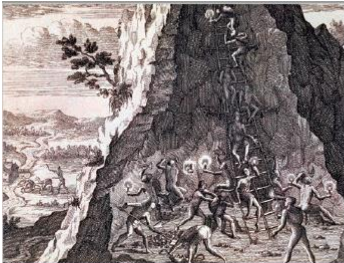
↑ De Bry, Theodor (siglo XVI). Mina de Potosí, Bolivia. [Grabado].

La minería fue la actividad económica más lucrativa de América. En una primera etapa los conquistadores se enriquecieron gracias al saqueo de los tesoros americanos, apoderándose del oro y la plata de los incas y los aztecas. Una vez agotadas esas riquezas, explotaron las minas de oro y plata que se descubrieron a lo largo de todo el continente. Para estas faenas se utilizó mano de obra indígena en diferentes sistemas de trabajo, predominando el reclutamiento forzado de ella.