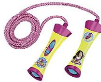
Cuerda para saltar $390

a.- ¿Cuánto dinero se necesita para comprar una pelota y un osito de peluche?