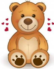
Osito de peluche $450