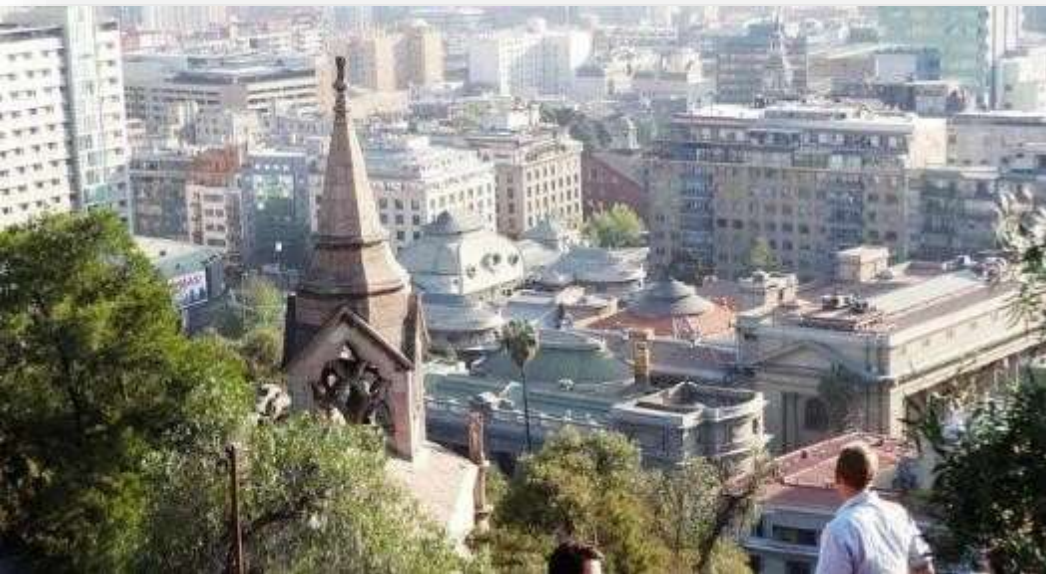
Panorama de Santiago en la actualidad

La pintura nos permite conocer nuestro pasado.