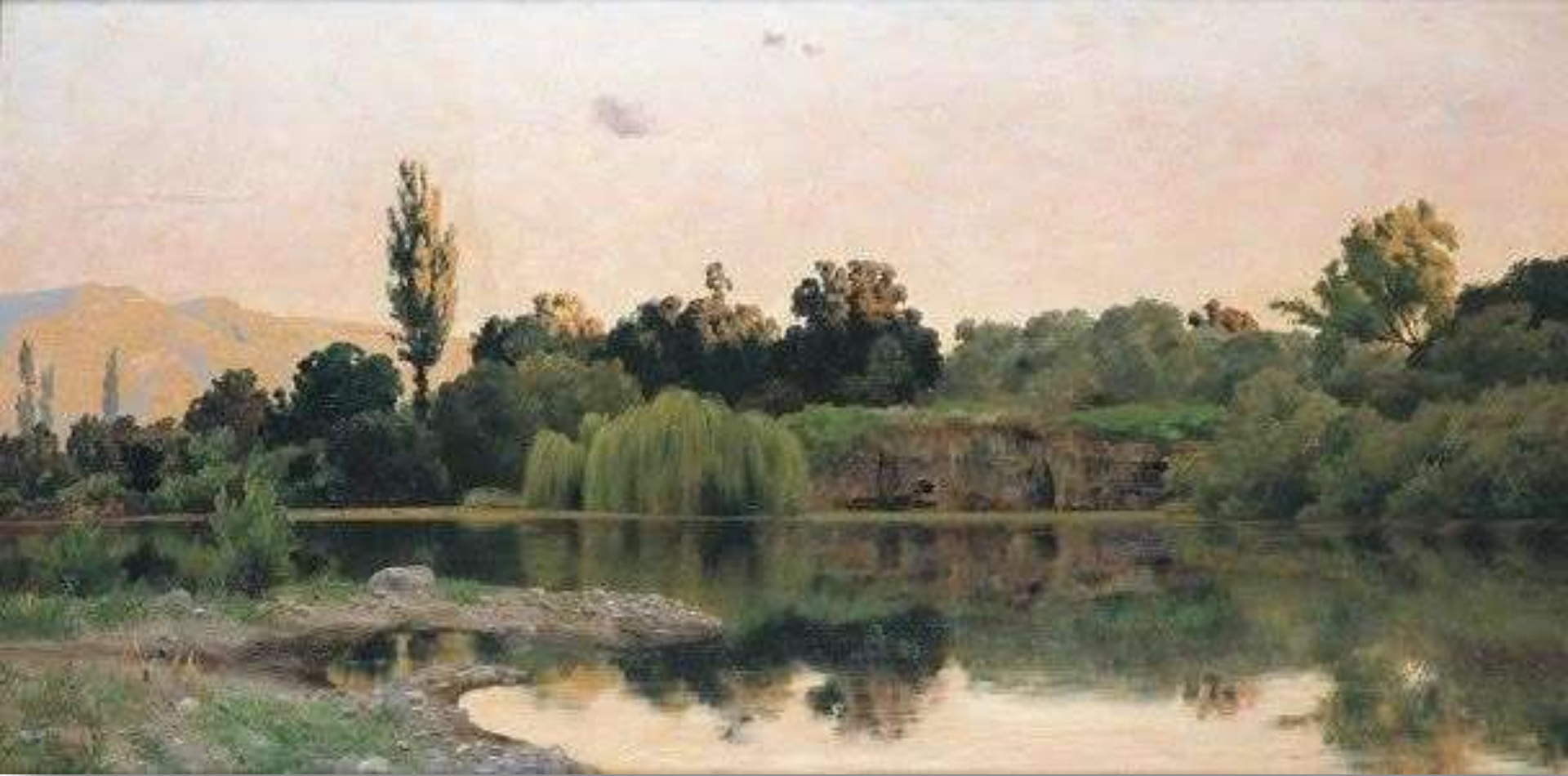
Atardecer en el estanque - Pedro Lira