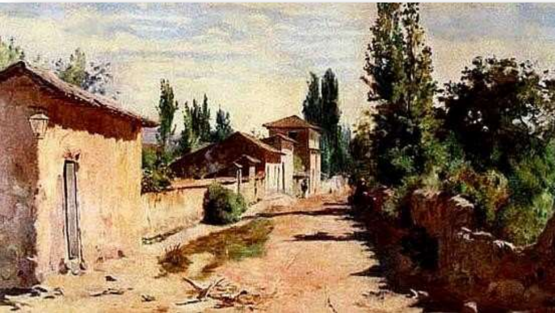
Pintura en el campo chileno – Alberto Valenzuela Llanos