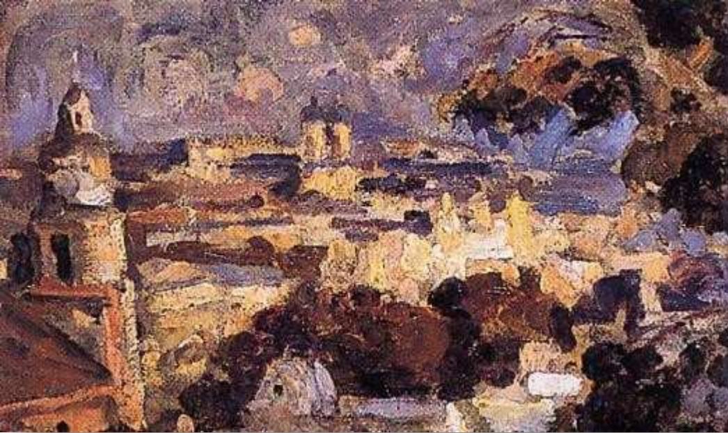
Panorama de Santiago - Juan Francisco González