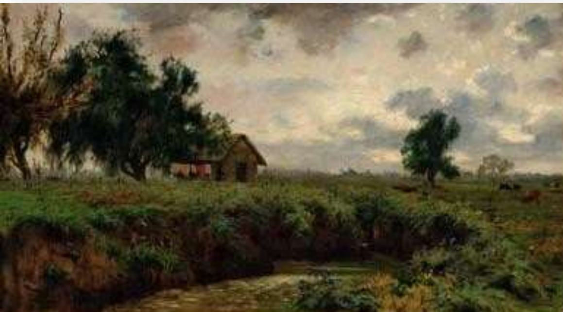
Paisaje campestre - Pedro Lira