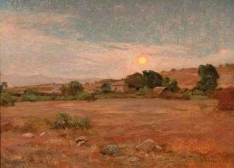
Puesta de sol - Alberto Valenzuela Llanos