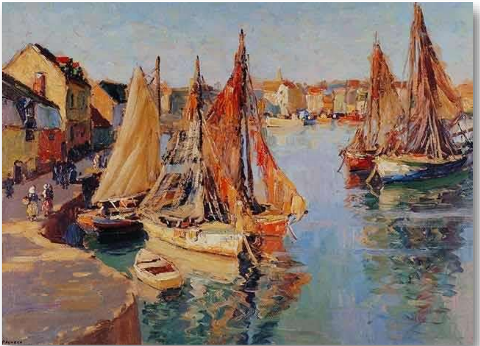
Astillero - Arturo Pacheco Altamirano