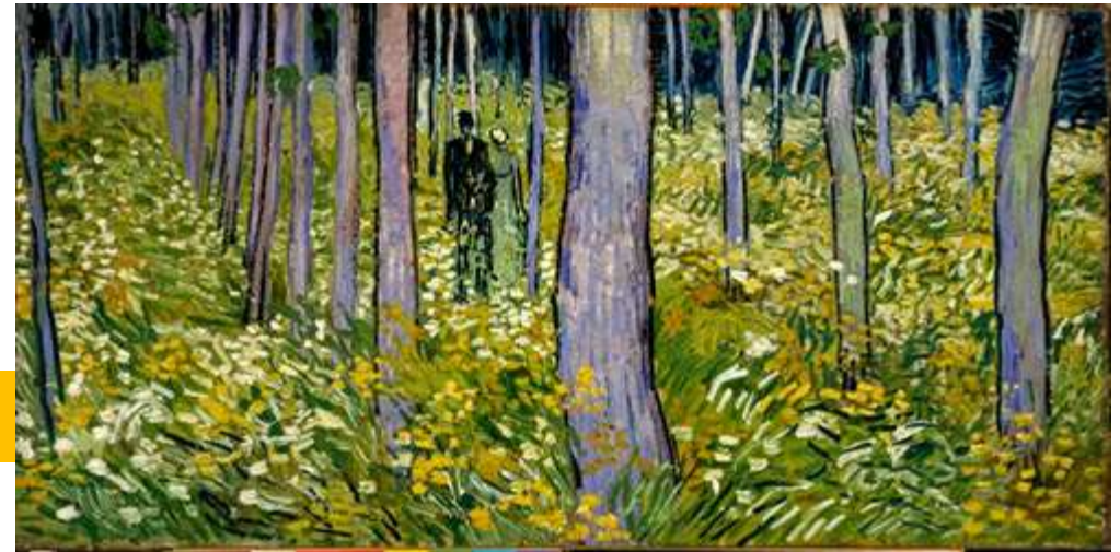
DOS FIGURAS EN EL BOSQUE