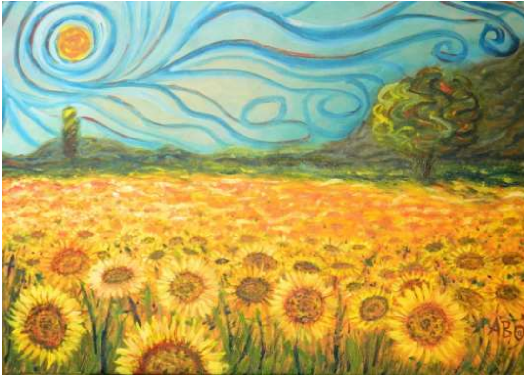
CAMPO DE GIRASOLES