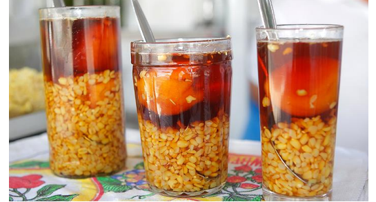
MOTE CON HUESILLO