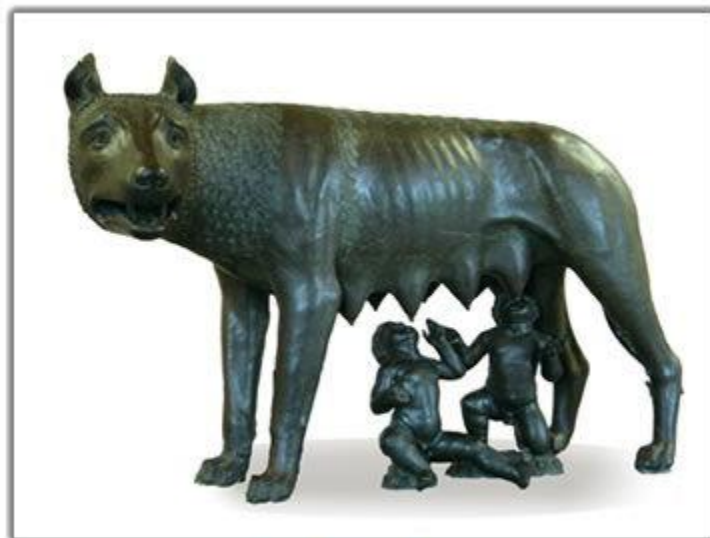
Rómulo y Remo

4.- La leyenda de Rómulo y Remo : Según se cuenta, los hermanos Rómulo y Remo fundaron la ciudad. Ellos habrían sido descendientes de Eneas (príncipe troyano), pero un enemigo de éste, para apoderarse del trono, los abandonó en las orillas del río Tíber, cuando aún eran muy niños. No murieron gracias a que una loba los alimentó . En agradecimiento, ellos decidieron fundar una ciudad en el mismo lugar donde el animal los había encontrado.