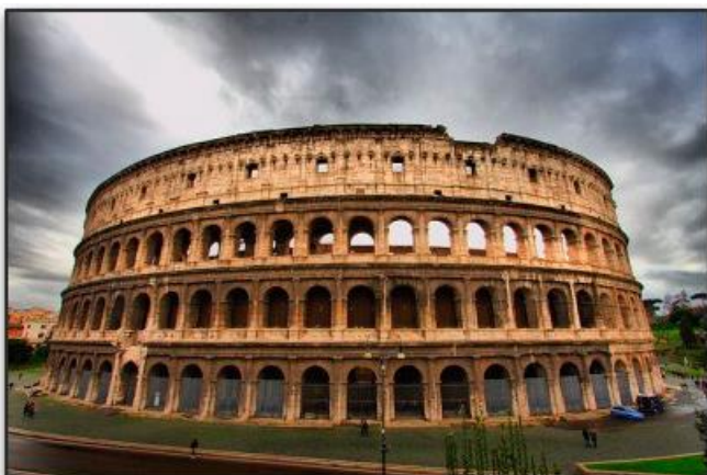
Vista de El Coliseo Romano

6.- Coliseo romano : A los romanos les gustaba mucho los espectáculos, y a los emperadores les importaba que su pueblo estuviera contento y entretenido. Es por eso por lo que construían diferentes edificios para que se divirtieran, como teatros, circos y anfiteatros. El Coliseo era un gran anfiteatro romano. Tenía forma ovalada y gradas (asientos) para que el público estuviera cómodo. Se realizaban diferentes espectáculos, como peleas con animales salvajes, y las famosas peleas con gladiadores, en donde se peleaban hasta morir. Sin embargo, cuando no resultaban heridos, el público votaba si vivía o moría, poniendo su pulgar arriba o abajo, y el emperador tenía la última palabra.