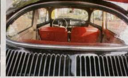
Interior en cuero rojo y rojo de un modelo de 1956. JAVIER PÉREZ