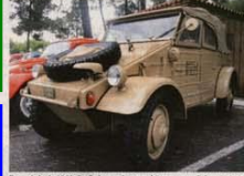
Escarabajo de 1943 diseñado para la segunda guerra mundial.