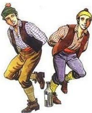
El costillar (zona sur),