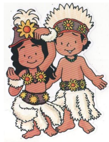
Sau sau (rapanui).