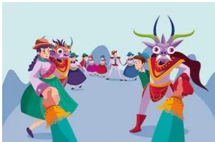
La diablada (zona norte)