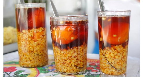
MOTE CON HUESILLO