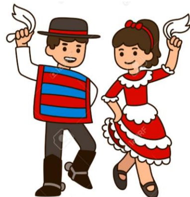
La cueca (zona centro)